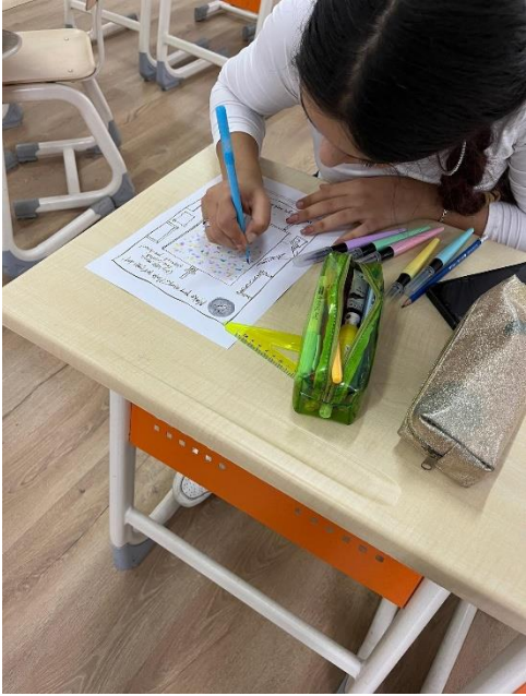
rugat-o să ne povestească ceva despre lucrarea ei: