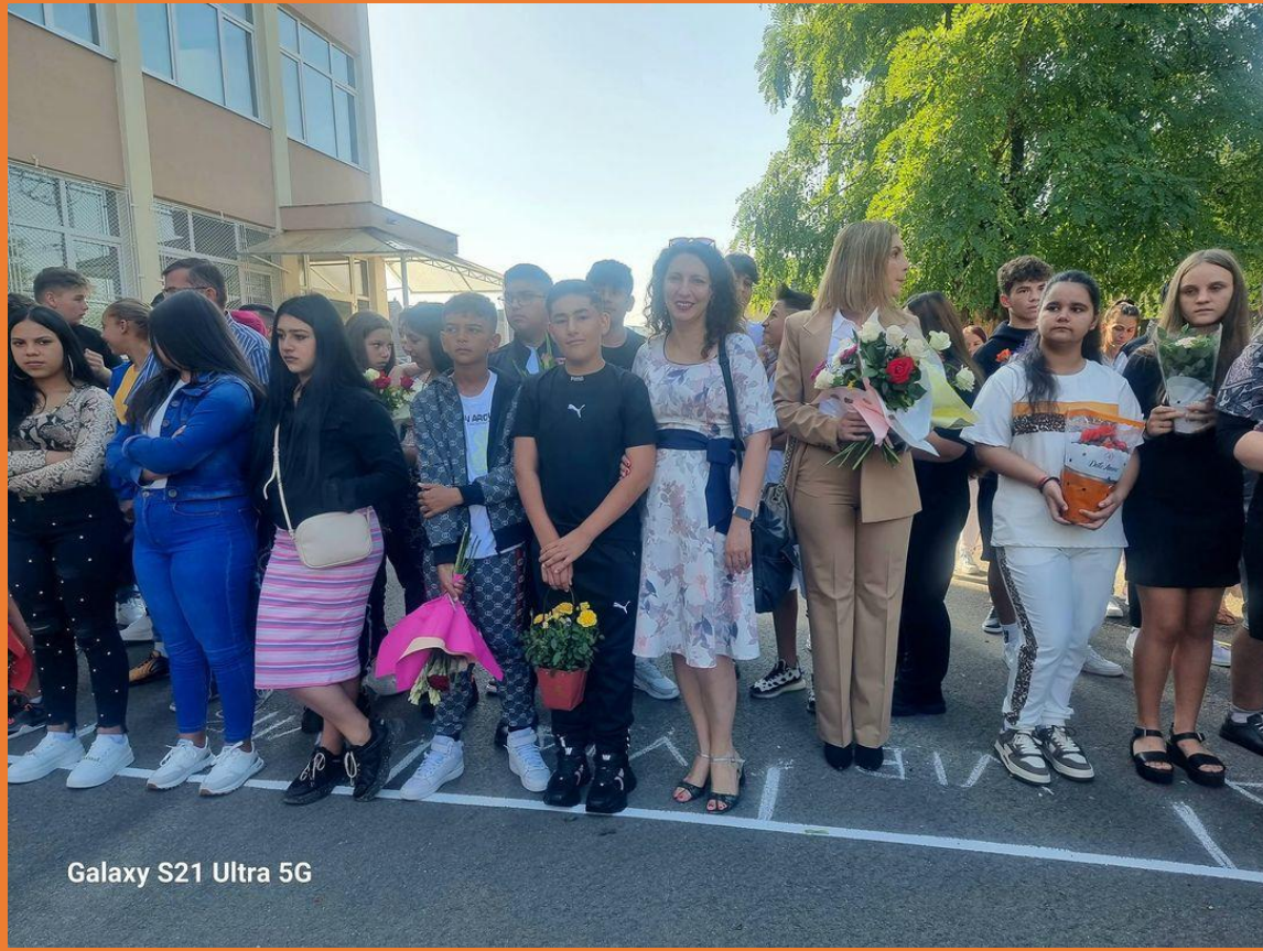
Galaxy S21 Ultra 5G